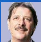
Paul Rechsteiner, Präsident, Schweizerischer Gewerkschaftsbund