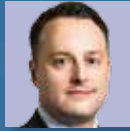
Dr. Sebastian Frehner, Nationalrat, Kommission für soziale Sicherheit und Gesundheit SGK