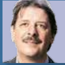
Paul Rechsteiner, Präsident, Schweizerischer Gewerkschaftsbund